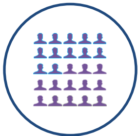
Organización & RRHH

Comparte con nosotros 1 hora de formación ágil y práctica, en temas que te ayudarán a la gestión y organización del laboratorio, según las normas ISO 17025 e ISO 15189