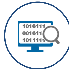
Control de Calidad