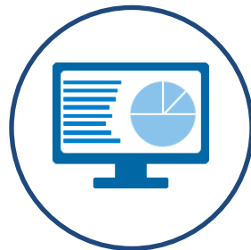
Objetivos & Indicadores